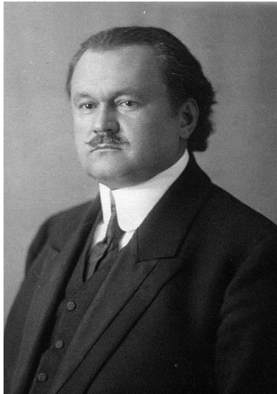
Н. Е. Марков

При этом Н. Е. Марков пребывал в уверенности, что русский народ только и ждет момента, чтобы выступить против советской власти. Ссылаясь на свои источники информации, он заявлял: «...Люди СССР отнюдь не нуждаются в растолковании их положения. Они великолепно его понимают — от мала до велика. Не отсутствие понимания, а реальная трудность предстоящего переворота останавливает их порывы к освобождению». Более того, Н. Е. Марков наивно верил, что «красная армия, конечно, давно восстала бы, если бы... если