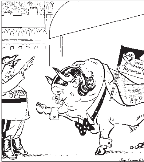
Карикатура Б. Е. Ефимова на Н. Е. Маркова (1936 г.)

стоянного массажа, жесткого ложа и простого сытного питания. Довольно баловались наши интеллигентные “господа”! Никто как они создали этот питательный бульон для разводки социалистических опытов и вивисекции Русского народа. Царь и народ: вот формула нашего времени. Это будет почище жидовской демократии и плутократии» 27 . Летом 1934 г. Н. Е. Марков, как бы оправдываясь в том, что его прогнозы о скорой советско-японской войне до сих пор не сбылись, пояснял племяннику: «фактически война между Японией и СССР уже происходит — в незримом плане. Война открытая также не очень замедлит, но весьма возможно, что разразится она в 1935 году. Какая жалость, что международная обстановка складывается так, что США оказываются в союзе с СССР,