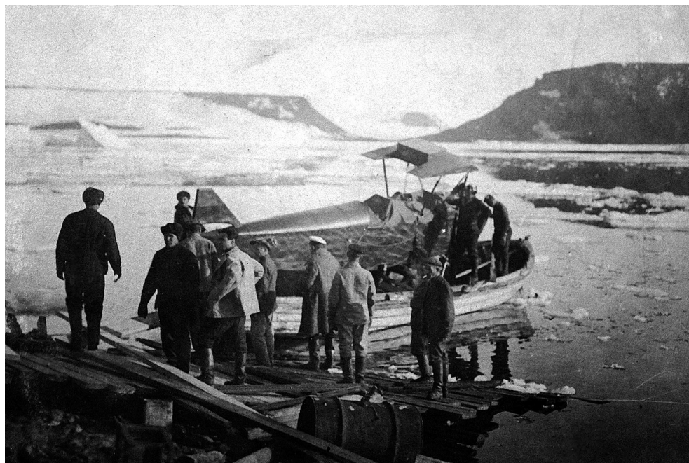
Выгрузка самолета У-2 (СССР Н-36) в бухте Тихой 1934 г.

К концу 1920-х гг. в связи с восстановлением экономики и ростом внимания государства к Арктике начали происходить значительные изменения в кадровом обеспечении советской научной деятельности в регионе. Они выражались, во-первых, в росте заработной платы в профильных учреждениях, занимавшихся арктическими исследованиями, которая была ощутимо выше, чем в среднем по экономике. Средняя ежемесячная зарплата научных сотрудников II разряда в Институте по изучению Севера в 1925–1926 гг. составляла 82 руб. 50 коп., директора института — 250 руб. 23 При этом средняя заработная плата лиц наемного труда по несельскохозяйственному сектору в 1926–1927 гг. была существенно ниже: 729 руб. ежегодно, или 60,75 руб. в пересчете на 12 месяцев 24 . В 1931 г. заработная плата директора ВАИ составляла 500 руб. в месяц, научных сотрудников — от 150 до 300 руб. 25 Зимовщики на полярной станции на Земле Франца-Иосифа получали от 175 до 400 руб. ежемесячно 26 . Для сравнения средняя зарплата по всем отраслям народного хозяйства в 1932 г. составляла 1551 руб. ежегодно, или 129,25 руб. ежемесячно 27 .