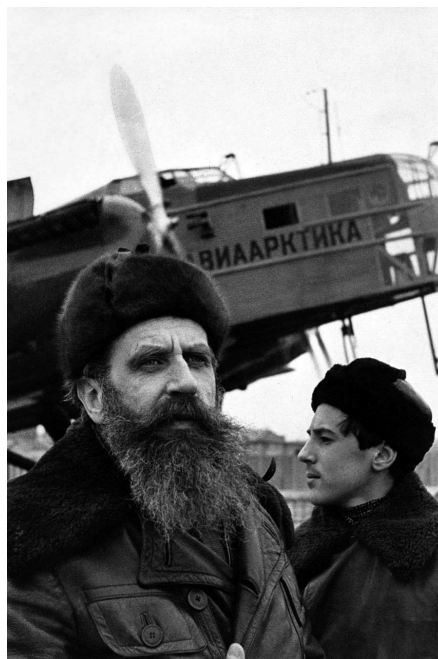
Отто Юльевич Шмидт