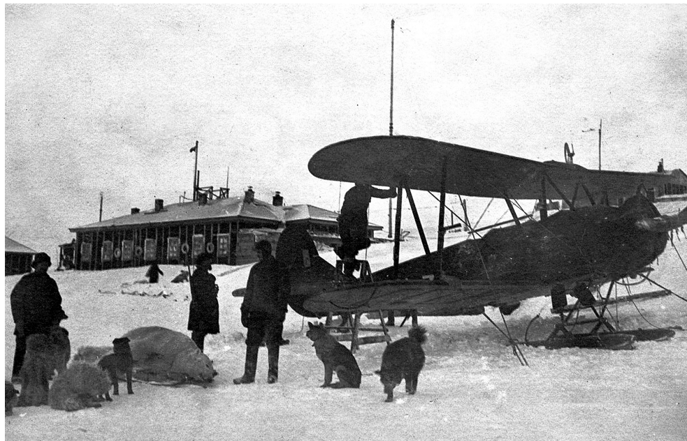
Полярная станция Бухта Тихая, Земля Франца-Иосифа, середина 1930-х гг.

недостаточность существовавшего уровня оплаты труда: «При существующей низкой оплате научных работников Арктический институт не в силах закрепить уже имеющихся в Институте квалифицированных специалистов, так как работники ВАИ получают меньше, чем научные работники других научных организаций, так например, минимальная ставка геолога в ЦНИГРИ (в Ленинграде) — 500 рублей, минимальная ставка геологов в ВАИ — 225 рублей, а максимальная ставка научного сотрудника-геолога 375–400 рублей, т. е. ниже минимальной ставки геолога в ЦНИГРИ. В таком же положении находятся и другие специалисты ВАИ». 58 По всей видимости, этот вопрос был успешно решен, поскольку уровень оплаты труда научных работников ВАИ повысился уже в 1938 г.: заработная плата директора составляла 1500 руб. в месяц, научных сотрудников — 500–900 руб. 59